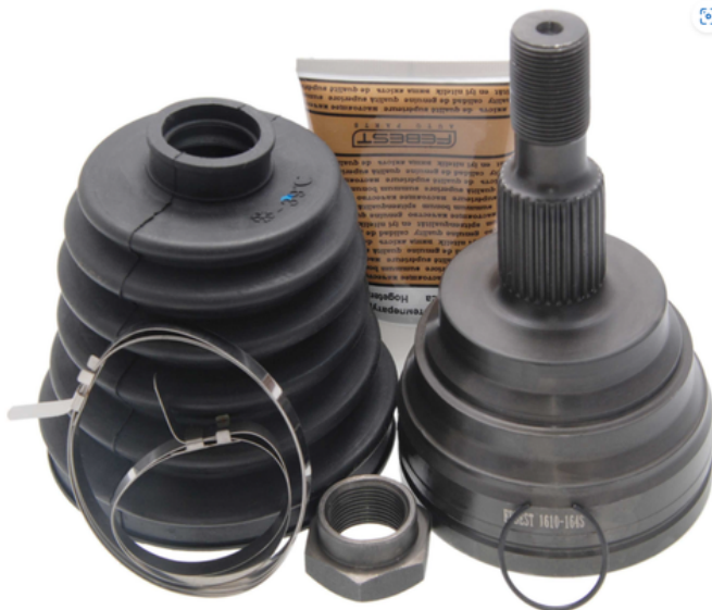
Imagen (zona de contacto real)